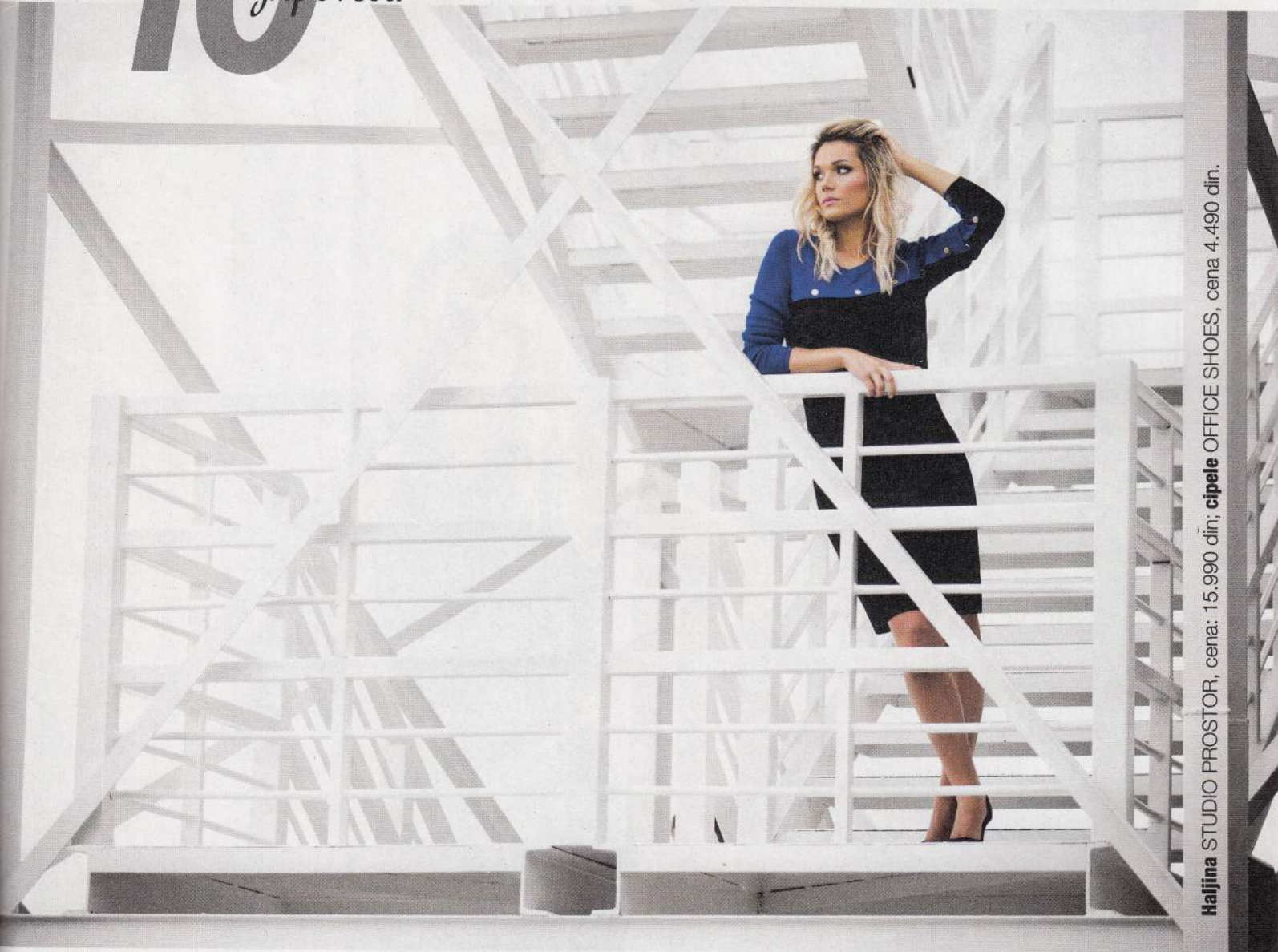
Hajina STUDIO PROSTOR, cena: 15.990 din; cipele OFFICE SHOES, cena 4.490 din.

am opterećena trendovima, ali uživam u modi i već godinama og meseca, s mnogo strasti i ljubavi, kupujem britanski Vogue . ro je pratiti i poznavati trendove, ići u korak sa svetom, prona i u svemu tome ono što nama odgovara. Kada je reč o garderobi, n dobre osnovne stvari , kao što su: farmerke, bela košulja, beli i sako, mantil, kožna jakna i čuvena, mala crna haljina. Kvalitet-vari lako se kombinuju. Detalji su veoma važni . Marama, do- komad nakita, šešir, kaiš, oni su kao dobra melodija. Uvek sam arolu manje je više , draže mi je da nosim manje nakita, ali vo- kad je detalj upadljiv, kao što je dobra, velika narukvica. Naučila da postoje stvari u koje je vredno ulagati, dobre cipele i tašna ostalu garderobu na pravi način. Jednostavna i nepretenciozna binacija, uz dobar par cipela govori sto jezika . Važno pravilo je- krojač za prijatelja . Kad poznajete dobrog krojača, to je kao da e dobrog zubara. Upoznala sam u Beogradu nekoliko dama koje ravi umetnici. Igram slučaja, pošto iznajmljujem mnogo garde- , shvatila sam s vremenom šta znači dobar kroj i koliko vredi nekoga ko može da nam prilagodi komad garderobe ili od ne-